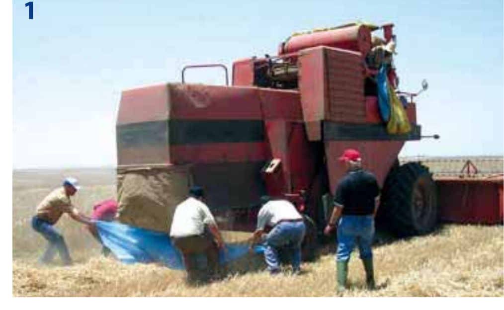
76 • Agriculture du Maghreb • n°15 • Juillet/Août 2010

Travail de détermination des pertes à la récolte sur moissonneuse batteuse (Région de Chaouen, Sud-Est de Settat)