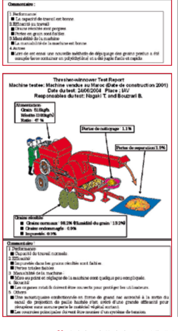
80 • Agriculture du Maghreb • n°15 • Juillet/Août 2010