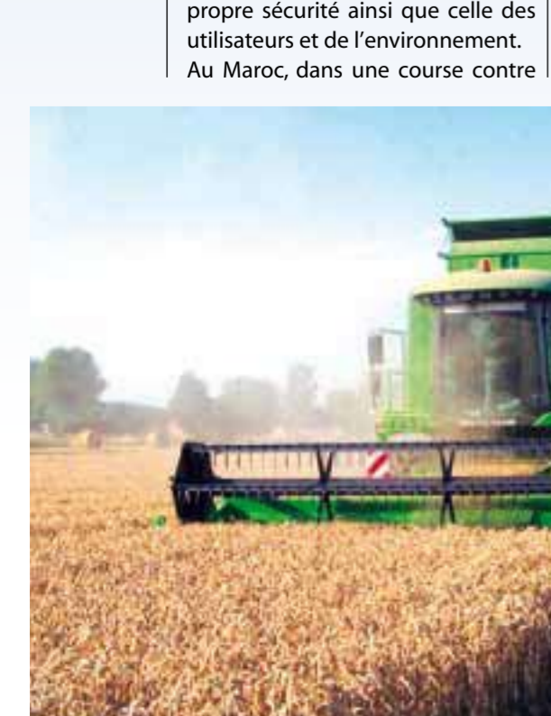
82 • Agriculture du Maghreb • n°15 • Juillet/Août 2010

La maintenance est l'ensemble des opérations d'entretien et de réparation effectuées sur un matériel tout au long de sa durée d'utilisation, en vue de garantir son bon fonctionnement. Il est primordial de maintenir convenablement un moyen de production et de l'utiliser correctement afin d'augmenter sa longévité, garantir sa rentabilité économique, offrir un service de qualité, assurer sa propre sécurité ainsi que celle des utilisateurs et de l'environnement. Au Maroc, dans une course contre