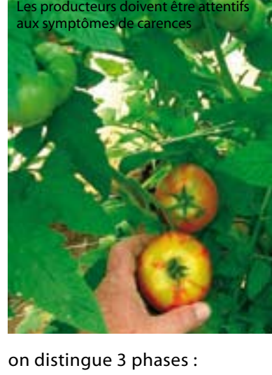
Les producteurs doivent être attentifs aux symptômes de carences