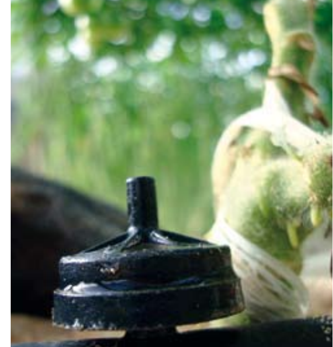
Le système d'irrigation doit assurer une répartition homogène de la solution fertilisante.

L'observation des défauts sur les fruits (défaut de calibre, défaut de coloration, points dorés, fermeté, fruit creux, microfissures) permet également de prendre des décisions, micro-ajustement de la fertilisation. Cependant, dans certains cas, les défauts peuvent être liés à d'autres facteurs (climat, rayonnement,...) ■