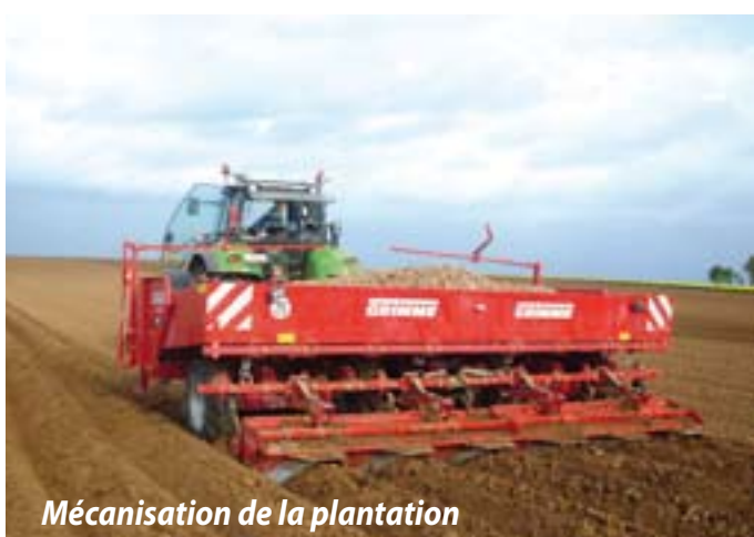
Mécanisation de la plantation