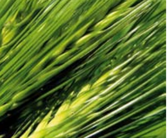
Agriculture du Maghreb n°38 - Octobre 2009

La variété est le produit de son environnement, un fait reconnu dans notre pays depuis le début du siècle dernier (1921). Mais ceci n'a pas empêché de recourir à l'importation de semences étrangères, parfois au prix d'un retard du développement agricole. Parmi les grandes mutations du milieu,