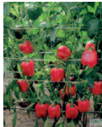
Le type Blocky(california) couvre 480ha en 2008/09, contre 400ha l'an passé.

Selon les statistiques de l'Établissement autonome de contrôle et de coordination des exportations (EACCE), avec 36.000 tonnes, les exportations de poivron tous types compris, affichaient au 4 avril dernier une hausse de 17% par rapport à la même période de l'année dernière. La quasi-totalité provenait de la région du Souss avec 35.160 t, pour seulement 29.850 t une année plus tôt.